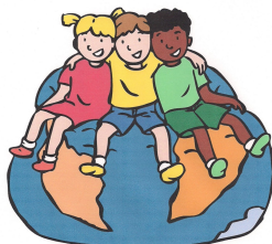
We horen bij elkaar

Ben je tussen 4 en 8 jaar en vind je het leuk om naar een verhaal te luisteren? Kom dan zaterdag 6 oktober naar de bibliotheek Hengelo, Beursstraat 34. We beginnen om 13:30 uur!